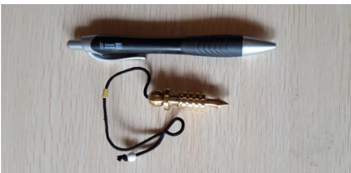
PENDOLO ISIDE STANDARD 25 EURO