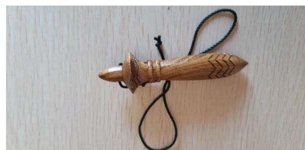
PENDOLO KARNAK INTAGLIATO vari legni (acero, noce, ulivo, maggiociondolo, ciliegio) 60 EURO