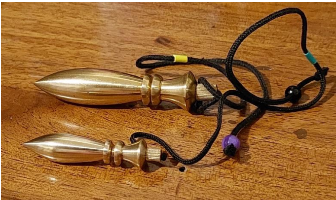
pendolo karnak standard 25 e grande 35