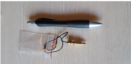
PENDOLO ISIDE BABY 15 EURO