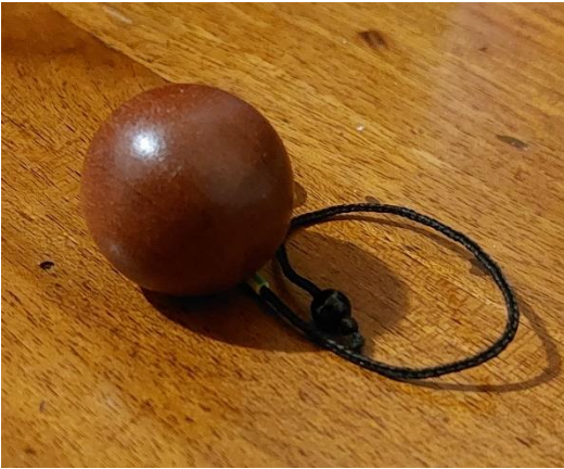
pendolo neutro 15 euro