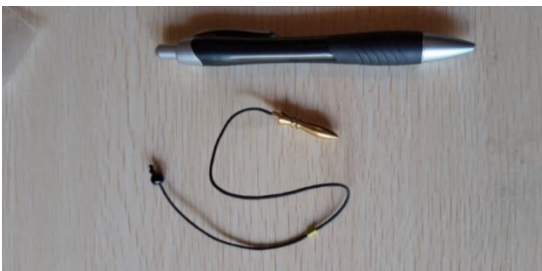
PENDOLO KARNAK BABY 15 EURO