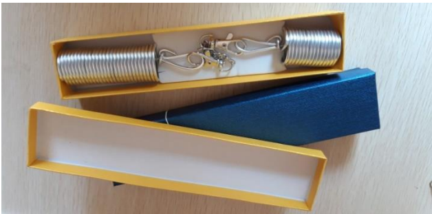
PTAH STANDARD 60 EURO