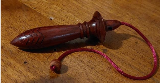
karnak legni pregiati (padouk, wengè, mogano) 70