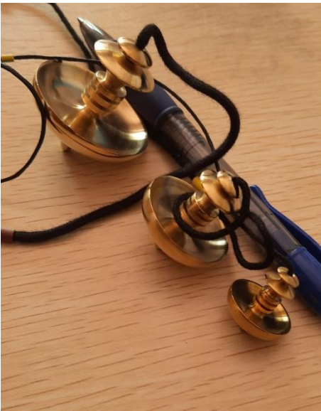
MERISI PICCOLO 28 EURO MEDIO 35 EURO GRANDE 45 EURO