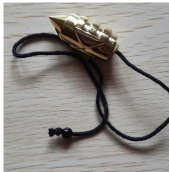
PENDOLO ATLANTIDE 52 EURO