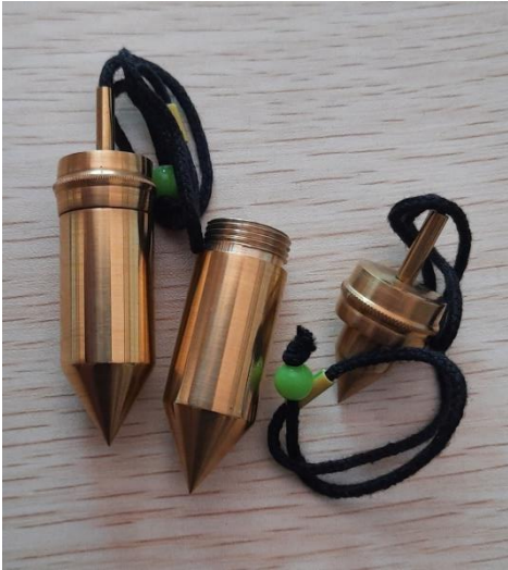
PENDOLO CONTENITORE 30 EURO