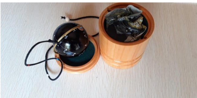
PU6 + SCATOLA 150 EURO 2 LIVELLO