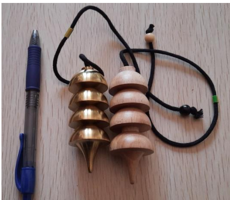
PENDOLO OSIRIDE 25 EURO LEGNO e 50 EURO OTTONE, smontabile ( 2 LIVELLO)