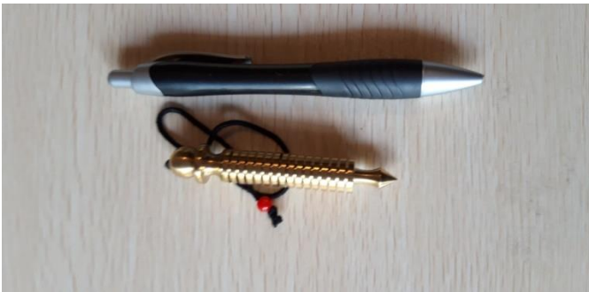
ISIDE 16 DISCHI 37 EURO 2 LIVELLO