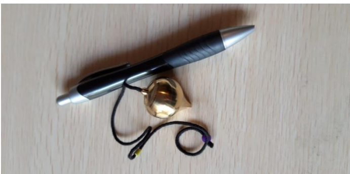
PENDOLO MERMET OTTONE 30 EURO