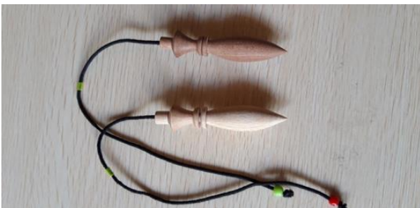
PENDOLO KARNAK FAGGIO 20 LEGNO SCURO 25 EURO