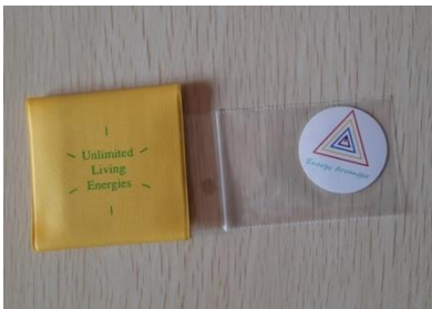
ENERGY ARRANGER 25 EURO (toglie il dolore, armonizza l'aura)