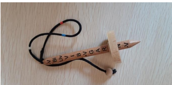
CONO FITTIZIO 28 EURO 2 LIVELLO