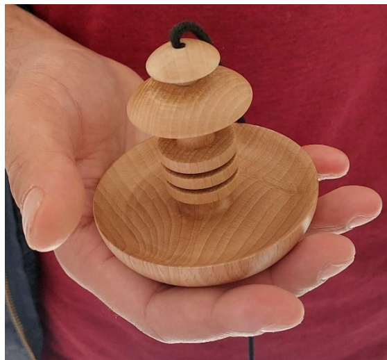
GIGANTE LEGNO 60 EURO