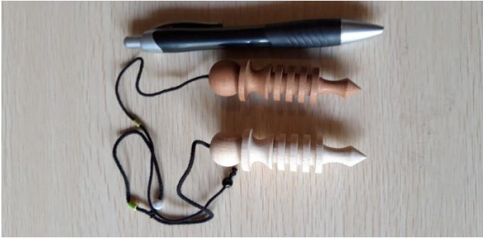
ISIDE FAGGIO 20 LEGNO SCURO 25 EURO