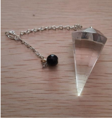
PENDOLO CRISTALLO 20 EURO