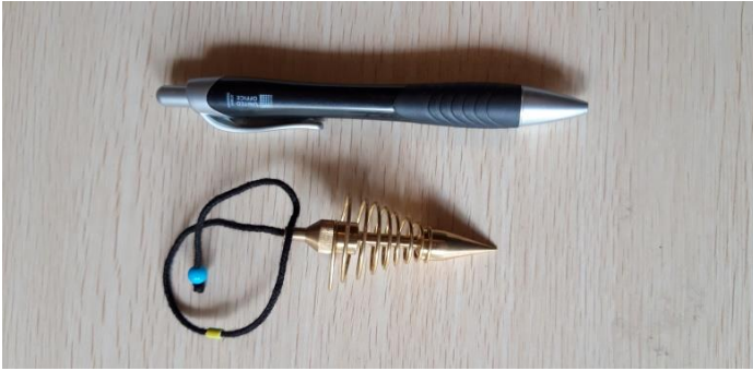
PENDOLO OTTONE SPIRALE 25 EURO