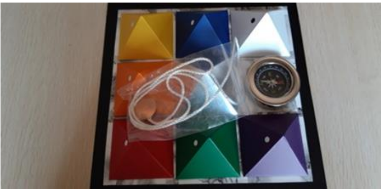
PIRAMIDI COLORATE 60 EURO