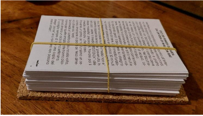
DOTTORE DI CARTA COMPRESO DI SUPPORTO CON CALAMITA 25 EURO 1 LIVELLO