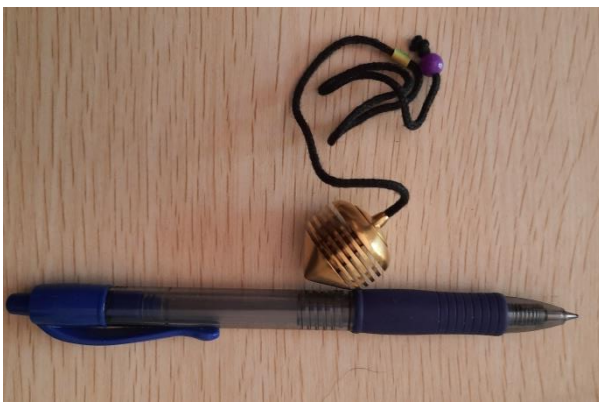
DISCHI 20 EURO (sigilla e armonizza i trattamenti)