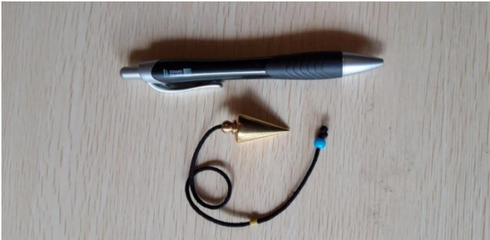
PENDOLO CONICO OTTONE 15 EURO