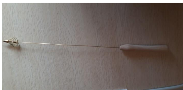
BIOTENSOR 25 EURO