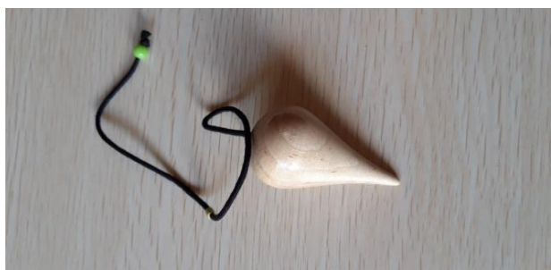
PENDOLO A GOCCIA FAGGIO 15 EURO