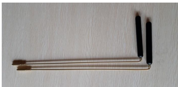
BACCHETTE 30 EURO