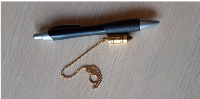
PENDOLO CILINDRICO 15 EURO