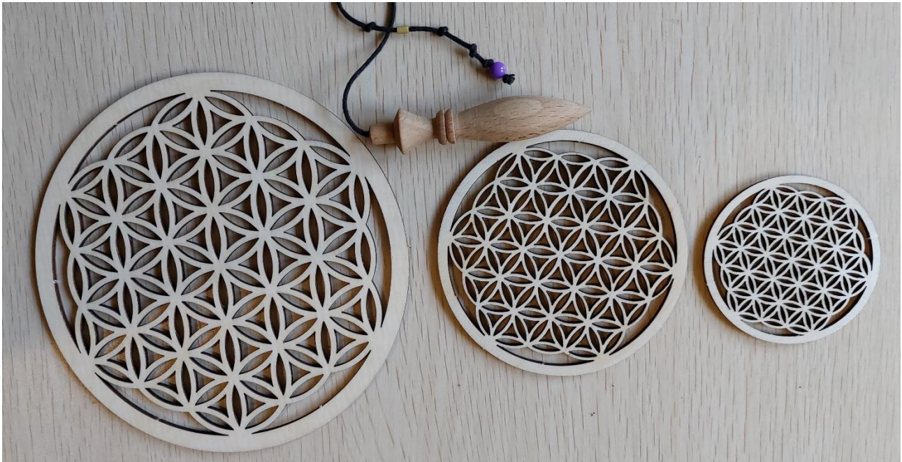
FIORE DELLA VITA IN LEGNO

Diametro 28 cm: 25 euro 22 cm: 10 euro 15 cm: 7 euro 9 cm: 5 euro 6 cm: 4 euro (ideale per bicchieri)