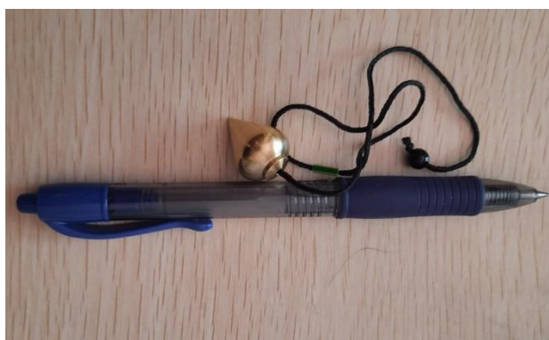
PENDOLO A GOCCIA OTTONE 15 EURO