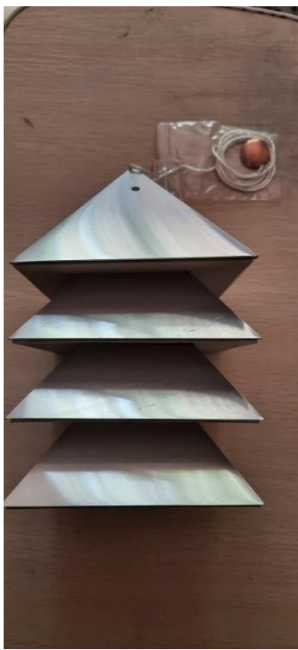
BATTERIA DI PIRAMIDI 30 EURO